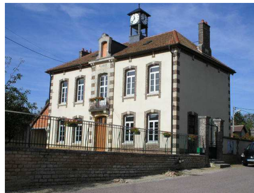
Ne pas jeter ce dépliant sur la voie publique