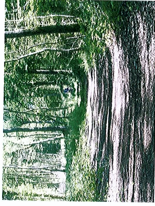
La forêt domaniale de Macey