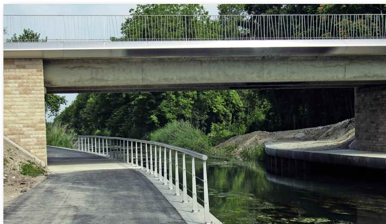
Vélo-voie au niveau de Saint-Lyé.

d'un cheminement pour piétons, cavaliers et pêcheurs de l'autre. Le Pays souhaite profiter de cet aménagement pour réaliser des petites randonnées autour du canal afin de faire découvrir le patrimoine de la vallée aux promeneurs.