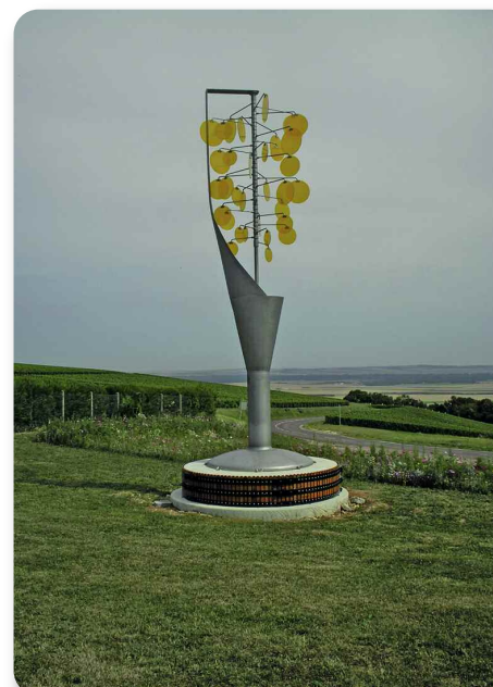
Sculpture d'une coupe de Champagne à l'entrée du village.

Au centre du village se situe l'église de l'Exaltation de la Sainte Croix de style gothique du début du XVI o siècle. Ce bel édifice a perdu par 2 fois son clocher en 1739 et lors de la tempête du 22 novembre 1938. De chaque côté de la porte d'entrée se trouvent deux magnifiques diptyques (volets en bois peints à l'huile) de 1571 représentant la crucifixion et la résurrection du Christ. A l'intérieur, on découvre une dalle de schiste noir aux effigies de Nicolas Riglet et de sa femme. Cet ancien maire de Troyes, mort en 1567, était seigneur de Montgueux.