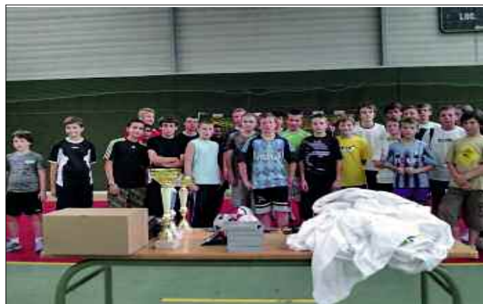
Tournoi de handball

Répondant à la demande des communes et aux besoins des jeunes, le Pays SMCC a mis en place depuis trois ans des activités pour les jeunes de son territoire. Ces activités sont offertes à tous les adolescents âgés de 12 à 17 ans résidant dans les 16 communes du Pays. Un animateur est recruté pour une période de quatre mois pour mettre en place ces activités. Cette année plus de 50 jeunes ont pu profiter des activités mises en place par le Pays. A titre expérimental, des chantiers de jeunes ont été réalisés sur les communes de Mergéy et de Saint-Benoît-sur-Seine. C'est un beau succès pour ces animations qui ont été proposées par notre animateur. L'initiative sera reconduite dans les années à venir.