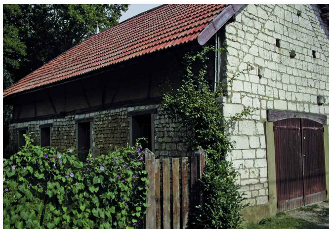
Maison traditionnelle en craie